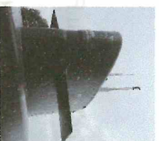
Voyage à Caen