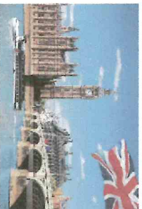
Voyage à Londres