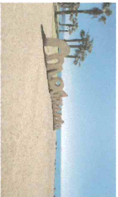
Voyage en Espagne