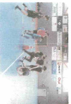
Festivités de fin d'année