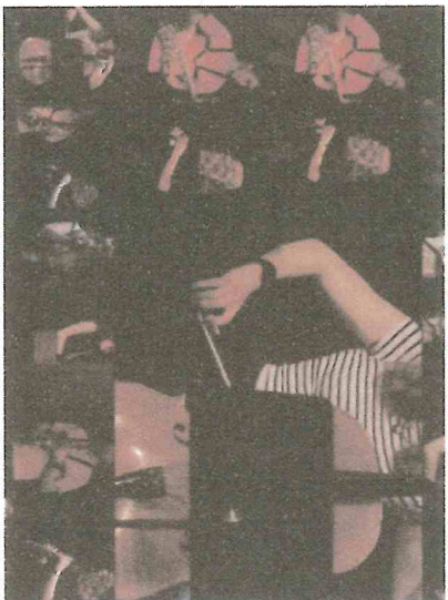
Les Etoiles de Galilée