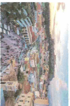
Voyage à Athènes

Attention : Les non-adhérents au FSE ne bénéficieront pas de réductions aux activités ou voyages pédagogiques