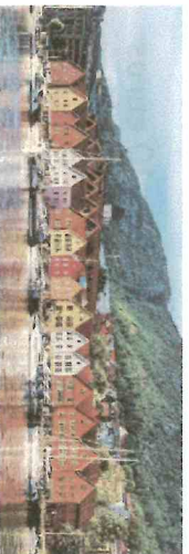
Voyage en Norvège